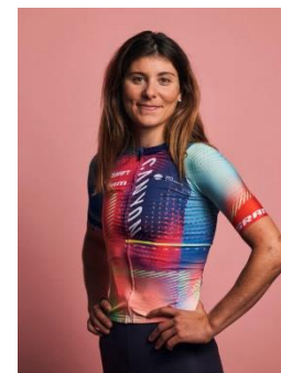
Strasse Canyon / SRAM Racing

Die Anmeldung, wie auch der Link für die Radbestellung findet ihr hier . Bitte beachtet, dass bei den Testrädern «first come – first serve» giltet. Bitte meldet euch bis zum 15. Mai an, damit alles geplant werden kann, danke.