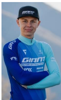
Herren U23 GIANT Factory Off-Road Team